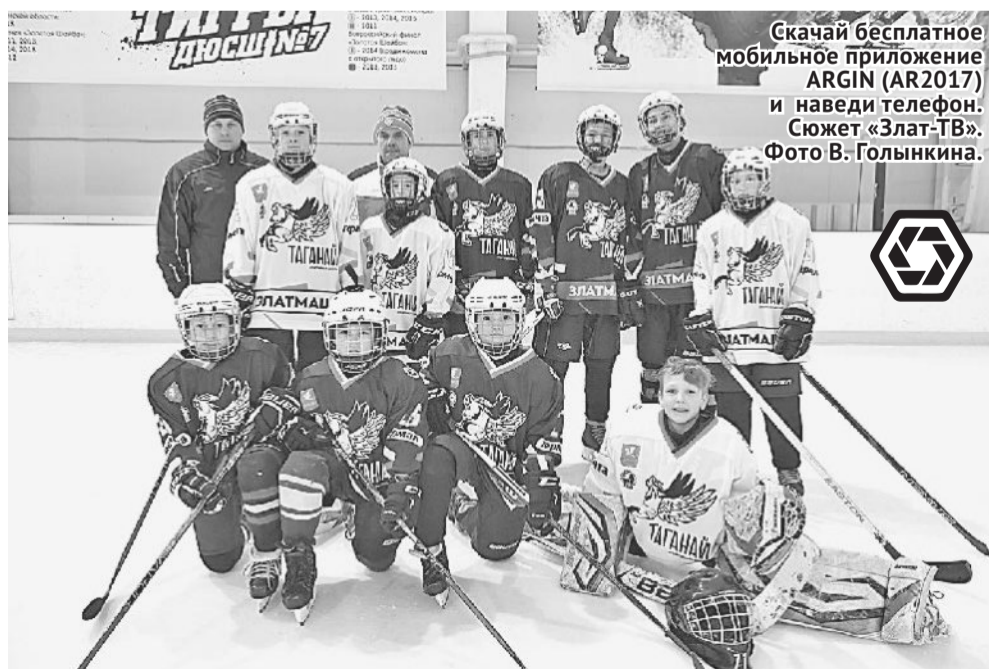
В НОВОЙ ФОРМЕ — К НОВЫМ ПОБЕДАМ!

вышли на всероссийский уровень, особенно остро встал вопрос разработки новой стильной и узнаваемой формы. За содействием администрация спортшколы